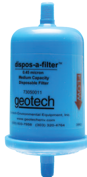
Geotech .45 微米 中容量 dispos-a-filter™ 滤芯