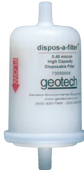
Geotech .45 微米 大容量 dispos-a-filter™ 滤芯