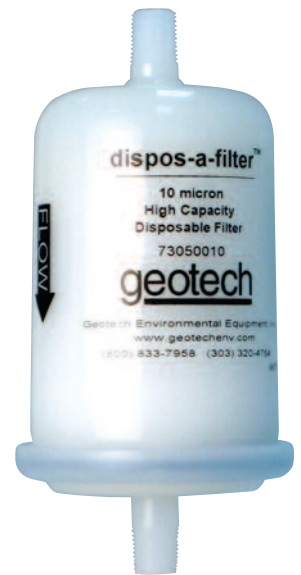
Geotech 10 微米 大容量滤芯 dispos-a-filter™