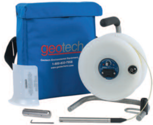
Geotech ET水位计和包装袋 (可选项)