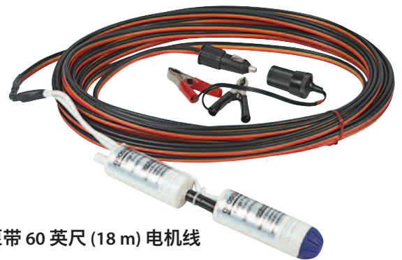
geosquirt™ 双级泵带 60 英尺 (18 m) 电机线