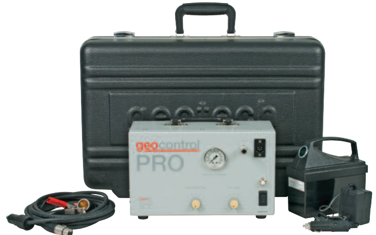
geocontrol PRO™ 及可选项装运箱、12V电池、充电器