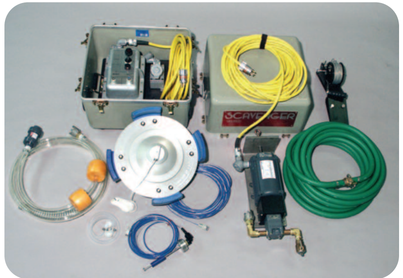
大直径漂浮式撇油器带可选的装箱

当收集的污染物将近一升的时候，自动开关会打开输送泵。这样，没有参杂水分的回收物会被输送到回收罐里。漂浮撇油器浮子内装有水分监测传感器。万一有水分流入收集腔里，密度传感器则会关闭掉传输泵并发出告警。这样的设计避免了水分混入回收产物里。