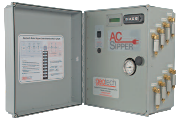
控制面板和压力/真空泵 (图示为八井控制器)