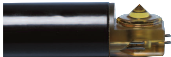
Standard 1" (2.5 cm) Intrinsically Safe Probe