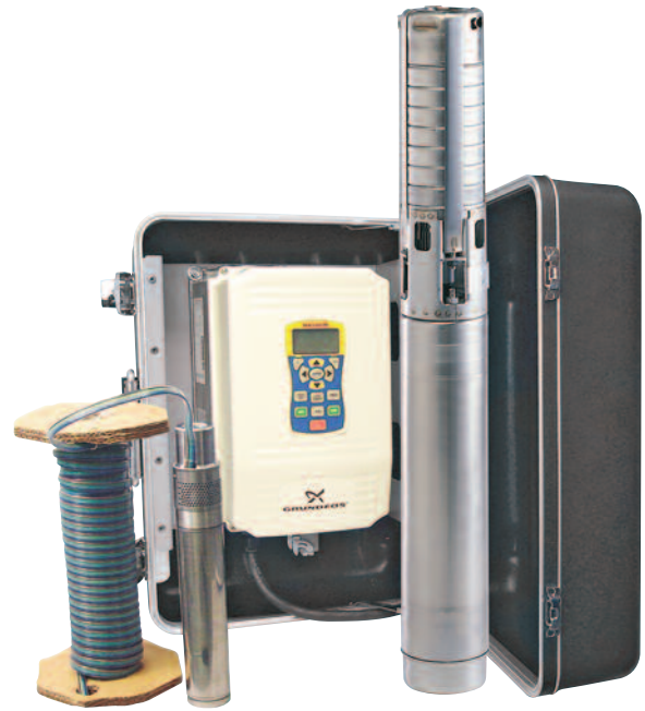
变频驱动器与Redi-Flo2® and Redi-Flo4™变频泵