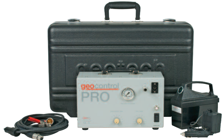
geocontrol PRO™ 及可选项装运箱、12V电池、充电器