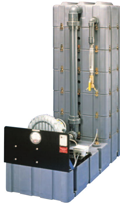
Geotech LO-PRO™ Model II 型

待处理的水从吉奥特吹脱塔的顶端进入设备，并自由跌落到第一级不锈钢孔板上。而位于每一层孔板中间的挡板会按照顺时针或逆时针方向依次逐层改变水流方向。该设计有效延长了水力停留时间，从而提高了去除率。